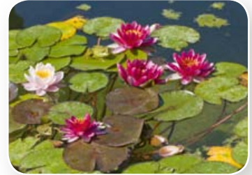
Amfibieën verschuilen zich vaak bij waterplanten.

Kikkers, padden en salamanders zijn amfibieën . Ze kunnen zowel op het land als in het water leven. Ze ademen met hun longen, maar ook door hun huid. Als amfibieën geboren worden lijken ze nog niet op hun ouders. Zo verandert kikkerdril eerst in een kikkervisje, voor het een volwassen kikker wordt. Amfibieën verschuilen zich vaak tussen planten die in of bij het water groeien. Waterplanten leven in het water. Voorbeelden daarvan zijn de waterlelie en kroos. Planten die aan de rand van sloten groeien noem je oeverplanten . De lisodde en de dotterbloem zijn oeverplanten. Bij de zee leven geen amfibieën. Zij kunnen namelijk niet tegen zout water. Andere dieren maken juist gebruik van het verschil tussen hoog en laag water langs de kust. Door het verschil in waterstand is daar veel voedsel te vinden. Als het eb is, zakt het zeewater. Bij vloed wordt het juist hoog water.