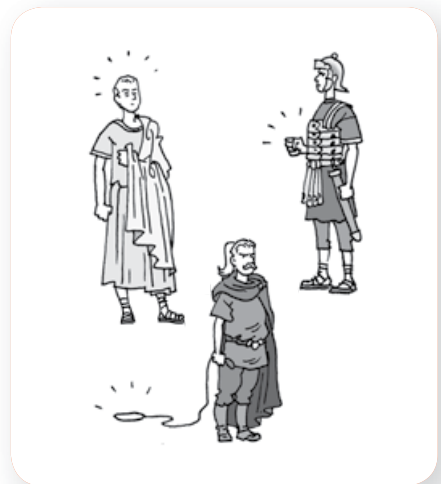
Verdeel en heers.

In 395 wordt het Romeinse Rijk in tweeën gedeeld. Steeds vaker worden de rijken aangevallen door andere volkeren. Bijvoorbeeld door de Hunnen. Veel volkeren slaan op de vlucht. Zo ontstaat een grote volksverhuizing. De Hunnen en andere volkeren vallen het Romeinse Rijk binnen. En ze winnen. Dit betekent de val van het West-Romeinse Rijk.