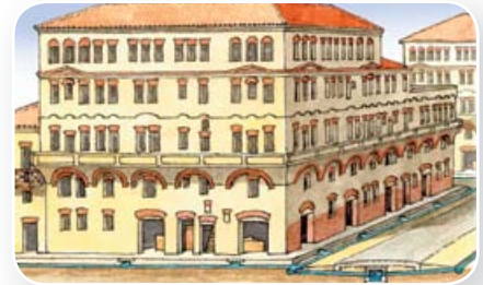
Onder de stoep ligt de riolering.

Rome heeft veel voorzieningen. Via aquaducten stroomt water naar de stad. Onder de stoep ligt een riolering. In de thermen kun je heerlijk baden.