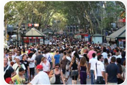
Lekker met z'n allen op vakantie.

Als je met de auto van het ene dal naar het andere rijdt, ga je over de bergpas. Dat is het hoogste punt van de weg. Maar vaak zijn er ook tunnels.