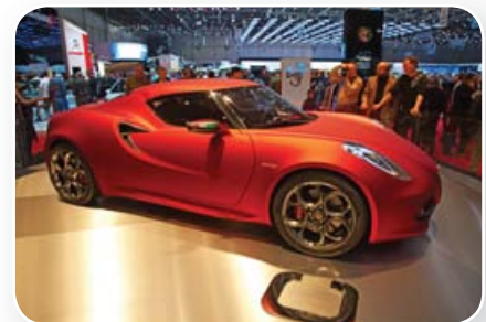
In Noord-Italië worden veel auto's gemaakt.

In het noorden van Italië zijn veel autofabrieken. Het in elkaar zetten van auto's noem je assemblage. Daarom noem je de auto-industrie een assemblage-industrie.